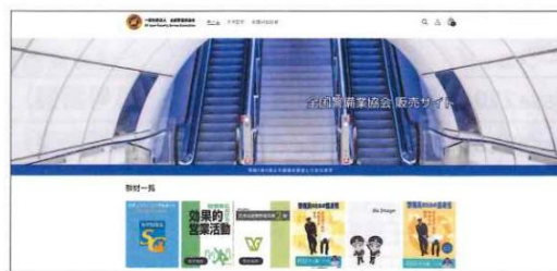
ECサイトTOPページ(イメージ)

○毎号、「セキュリティ・タイム」の書籍等の紹介ページにクーポンコードを掲載します。ECサイトの注文画面で、クーポンコードを入力することによって、 加盟員価格 が適用されます。(28ページ参照)